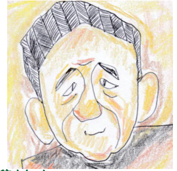
安倍さんは オリンピックができないと言うけれど...